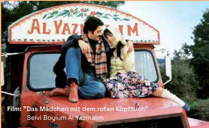
Film: “Das Mädchen mit dem roten Kopftuch” Selvi Boylum Al Yazmalım

Seit mehr als 60 Jahren ist sie künstlerisch erfolgreich und repräsentiert auch heute noch die goldenen Jahre des türkischen Kinos. Mit ihrer dauerhaften Popularität und ihrer starken Präsenz nimmt sie einen ehrenvollen Platz im Herzen der türkischen Bevölkerung ein. Die Türkischen Filmtage München freuen sich, Türkan Şoray den Ehrenpreis für ihr Lebenswerk überreichen zu können.